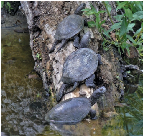
Emys orbicularis im natürlichen Lebensraum

In den nördlicheren Teilen des europäischen Verbreitungsgebietes hält die Europäische Sumpfschildkröte eine Winterruhe, während die Tiere im Süden im Winter zwar ihre Aktivität reduzieren, aber durchaus aktiv bleiben können. Auch in Mitteleuropa kann man in milden Wintern gelegentlich aktive Tiere in Freilandanlagen beobachten. Im Süden des Verbreitungsgebiets kann es, insbesondere wenn die Wohngewässer während des Sommers austrocknen, auch zu einer Sommerruhe kommen.