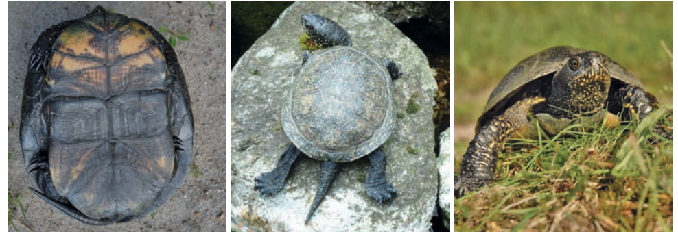
Bauchpanzer einer nördlichen E. orbicularis

Europäische Sumpfschildkröten sind morphologisch sehr variabel, zeichnen sich aber immer durch ein sogenanntes „Scharnier“ im Bauchpanzer aus, das eine lederartige Verbindung zwischen dem vorderen und hinteren Teil des Bauchpanzers darstellt. Da bei ausgewachsenen Sumpfschildkröten zudem die „Brücke“, die Verbindung zwischen Rücken- und Bauchpanzer, ebenfalls nicht verknöchert ist, erlaubt dies eine eingeschränkte Beweglichkeit der beiden Bauchpanzerteile. Dadurch können die Tiere die Panzeröffnungen etwas verkleinern, wenn sie sich bedroht fühlen. Alle Europäischen Sumpfschildkröten besitzen einen relativ langen Schwanz.