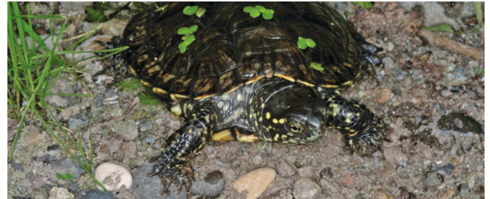
Drei Pilotprojekte zur Wiederansiedlung der Europäischen Sumpfschildkröte mit ausgewilderten Jungtieren werden derzeit in der Schweiz umgesetzt

Aktuell laufen in der Schweiz drei Pilotprojekte zur Wiederansiedlung der Art, zwei davon in der Westschweiz, eines im Tessin. Erst die Ergebnisse der Erfolgskontrollen dieser drei Projekte werden zeigen, ob weitere Wiederansiedlungen getätigt werden sollten und wie die Zukunft der Europäischen Sumpfschildkröte in der Schweiz aussehen könnte.