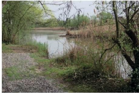
Ein Wiederansiedlungsgebiet in den Rheinauen

meist Tiere des Haplotyps IIa, der eine weite geographische Verbreitung von Mitteleuropa bis zur Donau-Mündung hat. Selbst unter der Voraussetzung, dass die Zuchttiere ausschließlich aus dem relativ großen Verbreitungsgebiet dieses Haplotyps stammen, existieren ihre nächsten natürlichen und stabilen Populationen erst in Ungarn, Kroatien und Slowenien oder in Mitteleuropa! Grundsätzlich ist nach dem gültigen Naturschutzrecht für das Aussetzen von Tieren, so auch bei Wieder-