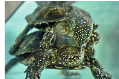
Bei der Paarung beißt das Männchen das Weibchen oft in den Kopf

Hat ein Männchen ein Weibchen gefunden, klammert es sich mit allen Vieren am Panzerrand der Partnerin fest und beginnt von oben herab in den Kopf des Weibchens zu beißen. Teilweise schlägt das Männchen auch mit seinem Kopf seitlich aus, sodass der Kopf des Weibchens in den Panzer gedrängt wird. Dabei streckt das Weibchen den Schwanz aus, wodurch seine Kloake für eine Paarung leichter zugänglich wird. Manchmal tragen Weibchen paarungswillige Männchen längere Zeit „huckepack“, und es sind auch Fälle bekannt geworden, bei denen Weibchen von einem paarungswilligen Männchen regelrecht ertränkt wurden.