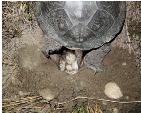
Ein Weibchen bei der Eiablage

Der Beginn der Eiablage ist fast im gesamten europäischen Verbreitungsgebiet erstaunlich konstant, wobei in Mittel- und Osteuropa meist nur ein Gelege, im Süden des Verbreitungsgebiets aber bis zu drei Gelege abgesetzt werden können.