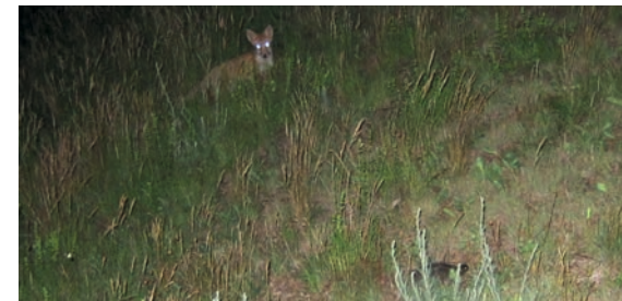
Ein wichtiger Fressfeind von Emys orbicularis (im Vordergrund): der Fuchs

Für Europäische Sumpfschildkröten ist eine Vielzahl von Fressfeinden bekannt. Tatsächlich werden die meisten Gelege geplündert, und nur ein kleiner Teil der geschlüpften Jungtiere erreicht das Erwachsenenalter. Dafür sorgen vor allem Wildschweine, Füchse, Dachse, Marder und im Süden des Verbreitungs-