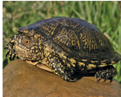
Westliche Sumpfschildkröte aus der Region Tudela (Navarra, Spanien)