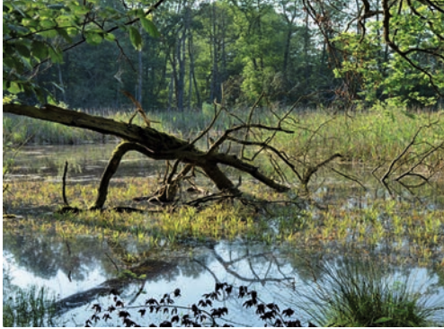
Idealer Lebensraum: strukturierte Gewässer- und deckungsreiche Uferpartien

Pflegemaßnahmen in Sumpfschildkrötengewässern, wie beispielsweise die Entnahme von Vegetation (zum Beispiel Breitblättriger Rohrkolben) sind ebenfalls mit äußerster Vorsicht, möglichst manuell vorzunehmen. Nur auf diese Weise kann eine erhebliche Störung oder gar Verletzung von Tieren ausgeschlossen werden.