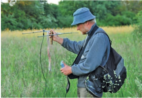
Auf der Suche nach besonderen Tieren – Telemetrie

Aussagen zum Zustand der Sumpfschildkrötenpopulationen sind nur auf der Grundlage quantitativer Daten möglich. Die Bestandserfassung und das Populationsmonitoring bilden die Basis, um den Zustand einer Population und somit den Erfolg der Schutzmaßnahmen einzuschätzen. Nach der Fauna-Flora-Habitat-Richtlinie sind die Länder der Europäischen Union verpflichtet, eine langfristige Bestandsüberwachung für Arten von gemeinschaftlichem Interesse durchzuführen.