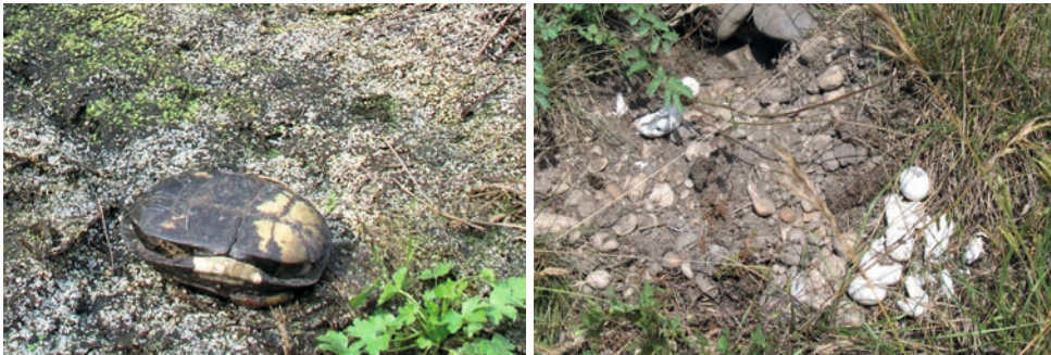
Diese Europäische Sumpfschildkröte wurde von einem Waschbär getötet. Ein von Fressfeinden geplündertes Gelege

Seit etwa 10–12 Jahren finden sich in den letzten Vorkommen heimischer Sumpfschildkröten zunehmend geplünderte Nester, verletzte Tiere und Überreste gefressener Sumpfschildkröten. Diese Beobachtungen sind nur zum geringen Teil den zahlenmäßig gewachsenen Populationen heimischer Prädatorenarten wie Wildschwein, Fuchs und Dachs zuzuschreiben. Der inzwischen als „Schildkrötenkiller“ bedeutendste Fressfeind einheimischer Sumpfschildkröten ist der Waschbär, der sich seit Ende der 1990er-Jahre auch in Norddeutschland mit zunehmender Häufigkeit ausbreitet. Aufgrund seiner ausgesprochenen Lernfähigkeit und optimierten Jagd- und Sammeltechnik im Flachwasser ist der Waschbär in der Lage, sich sehr schnell lokale Sumpfschildkrötenbestände aller Altersklassen als Nahrungsressource zu erschließen. Darüber hinaus findet er auch Gelegeplätze und plündert die Nester. Dieselbe Bedrohung geht von dem etwa zeitgleich eingewanderten Marderhund (Ursprungsgebiet Ostasien) aus.