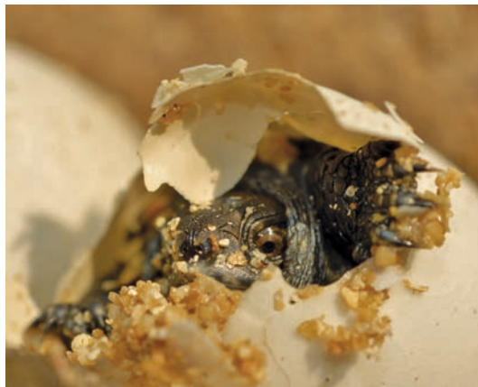
Schlupf einer kleinen Europäischen Sumpfschildkröte

Im gesamten Verbreitungsgebiet scheint es zwei verschiedene Schlupfstrategien der Jungtiere zu geben: Entweder verlassen die kleinen Schildkröten schon im September desselben Jahres die Nesthöhle oder sie überwintern, bereits geschlüpft, in der Gelegegrube und verlassen diese erst im Frühjahr des darauffolgenden Jahres. Liegen die Eiablagestellen der Weibchen weit vom Gewässer entfernt, kann man die Jungtiere nach dem Schlupf ebenfalls auf erstaunlich weiten Überlandwanderungen antreffen.