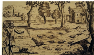
Schildkröten-teich aus HOHBERG, W.H. (1682): Georgica curiosa. Adeliges Land- und Feldleben. - Ausgabe Martin Endtner, 1701, Nürnberg

Noch vor wenigen Jahrhunderten war die Europäische Sumpfschildkröte in Mitteleuropa weit verbreitet. Schon prähistorisch hat sie in einigen Regionen die Nahrungspalette der Menschen bereichert. Darüber hinaus dienten ihre Panzer als Gebrauchsgegenstände und fanden unter anderem als Schüsseln oder Kehrschaufeln Verwendung. Vor allem aus dem 17. und 18. Jahrhundert belegen zahlreiche Quellen, dass die Bestände sowohl im süddeutschen Raum als