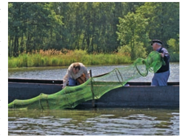
Die Reusenfischerei ist eine potenzielle Gefahr für die Schildkröten

Der Fang und Handel einheimischer Sumpfschildkröten ist bereits seit Jahrzehnten verboten. Trotzdem liegen auch aus jüngerer Vergangenheit mehrere Fälle illegaler Naturentnahmen sowie Vermarktungen heimischer Sumpfschildkröten vor. Auch dieser Gefährdungsfaktor ist demnach bis heute nicht zu vernachlässigen.