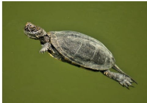
Emys orbicularis hellenica vom Balkan