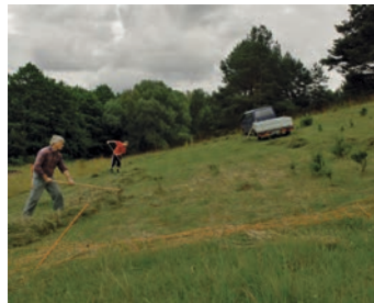
Schonende Mahd des Gelegehügels

Die Landnutzung im Umfeld der Schildkrötengewässer spielt eine große Rolle. Schon aufgrund der bei Sumpfschildkröten sporadisch immer wieder auftretenden Überlandwanderungen ist zum Beispiel intensiver Ackerbau im Umfeld besiedelter Gewässer problematisch. Ackerflächen im Jahreslebensraum sollten daher möglichst in extensiv genutzte Wiesen und Weiden umgewandelt werden. Als Gelegeplatz nutzen Europäische Sumpfschildkröten mikroklimatisch günstige Flächen, im Ideal-