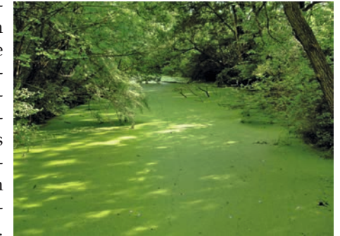
Altarm im Nationalpark Donau-Auen (Fadenbach)

Die Donau-Auen, die seit 1996 zwischen Wien und Bratislava zum Großteil (9.300 ha) Nationalparkgebiet sind, bilden einen Lebensraum, in dem sich noch großräumig vernetzte Wasserflächen erhalten haben, mit verschiedensten Ausprägungen von Wasserhabitaten und relativ geringer Beeinflussung durch den Menschen. Die Schildkröten besiedeln vorwiegend stehende Altarme der Donau,