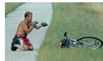
Störungen der Tiere sind zu vermeiden

Europäische Sumpfschildkröten reagieren empfindlich auf Störungen. Einheimische Reliktvorkommen haben in Mitteleuropa bis in die Gegenwart ausschließlich in ausgesprochen abgelegenen und kaum zugänglichen, naturnahen Lebensräumen überlebt. Touristisch stark frequentierte Landschaften sind als Lebensraum ungeeignet.