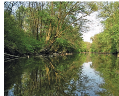
Dieser Altarm im Nationalpark Donau-Auen (Tiergartenarm) ist ein idealer Lebensraum für Europäische Sumpfschildkröten