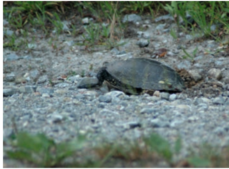
Die Eiablage findet im Nationalpark Donau-Auen im Schotterbereich der Flüsse statt

die von der Flussdynamik lediglich bei Hochwasserereignissen beeinflusst werden. Die Schotterböden mit trockenen Wiesen und sogenannten Heißländern (Brennen = alte Schotterablagerungen in den Randzonen der Flüsse) dienen als mögliche Eiablageplätze, doch werden auch natürliche und künstliche Böschungen und Uferanrisse angenommen. Gute Bestände von reproduzierenden Amphibien und Wassermollusken liefern ein ausreichendes Nahrungsangebot.