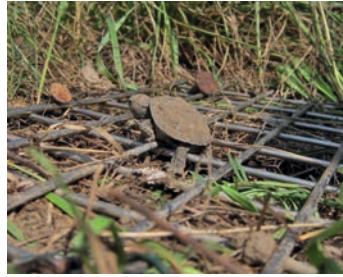
Abdeckung der Nester mit Drahtgitter

Die Abwehr von Prädatoren beginnt an den Schildkrötengelegen. Hierfür empfiehlt sich die Abdeckung der Nester mit Maschendraht oder einem Gitter in einer Größe von mindestens 60 x 60 cm (Maschenweite ca. 3 cm). Der Maschendraht wird mit mehreren mindestens 40 cm langen Erdnägeln am Boden befestigt. Kurz nach der Eiablage haben sich zur Abwehr von Prädatoren auch intensive Geruchsstoffe (zum Beispiel Mückenspray) im Umfeld des Nestes bewährt. Voraussetzung für den Schutz der Gelege ist die Kenntnis ihrer Standorte. Zu diesem Zweck werden die Gelege-