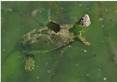
Emys orbicularis orbicularis (Haplotyp IIa)

Tatsächlich ist die Informations- und Indizienlage rund um das Vorkommen der Europäischen Sumpfschildkröte in der Schweiz verworren, und auch historische faunistische Quellen zeichnen diesbezüglich kein klares Bild. Erschwerend kommt hinzu, dass die Europäische Sumpfschildkröte möglicherweise bereits in prähistorischer Zeit, sicher aber im Mittelalter als Handelsware – sie galten als Fastenspeise – in die Schweiz eingeführt und mit hoher Wahrscheinlichkeit auch freigesetzt wurde. Zusätzlich kompliziert wird eine Beurteilung der Situation heute auch durch die zwischen 1950 und 1980 an verschiedenen Orten durchgeführten