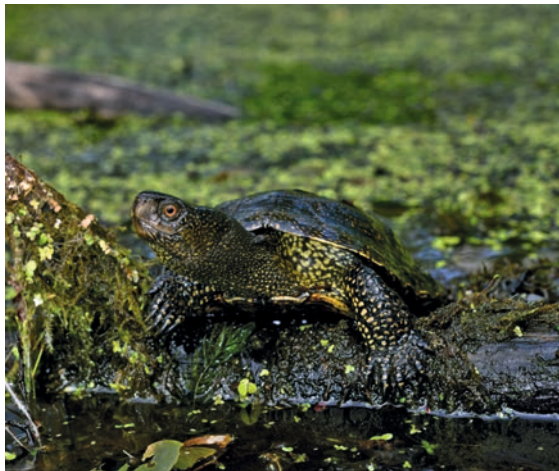
Die Europäische Sumpfschildkröte erfreut sich auch in der Bevölkerung einer gewissen Popularität

Im Gegensatz zu anderen Reptilienarten erfreut sich die Europäische Sumpfschildkröte in der Bevölkerung einer gewissen Popularität und stößt bei einem weiten Kreis von Schildkrötenhaltern auf großes Interesse. Entsprechend vielfältig und zahlreich waren und sind denn auch die Bestrebungen, diese attraktive Schildkröte in verschiedenen Gewässerkomplexen anzusiedeln oder wiederanzusiedeln. Grundsätzlich begrüßt die Karch diese Bemühungen, setzt sich aber vehement dafür ein: