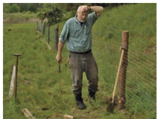
Einzäunen des Eiablageplatzes

plätze beispielsweise in Brandenburg seit Jahren während der Eiablagessaison aus größerer Distanz von erfahrenen Mitarbeitern des Schutzprojekts beobachtet. Sofern der gesamte Gelegeplatz (größere Fläche mit mehreren Gelegen) eingezäunt wird, ist der Zaun so zu stellen, dass die Schildkrötenweibchen ungehinderten Zugang haben. Letzteres ist alljährlich zu prüfen und gegebenenfalls nachzubessern. Die Einzäunung des Gelegeplatzes ist nicht grundsätzlich zu empfehlen und kann auch nachteilige Effekte (siehe unten) hervorrufen. Sie schützt die Nester vor allem vor Wildschweinen. Fuchs, Marder, Waschbär und eventuell weitere Arten finden trotzdem Zugang. Es empfiehlt sich daher auch bei eingezäunten Gelegeplätzen, Einzelgelege mit Maschendraht zu sichern. Ein nachteiliger Effekt der Einzäunungen ist die ungehinderte Entwicklung der Vegetation. Der fehlende Zugang äsender