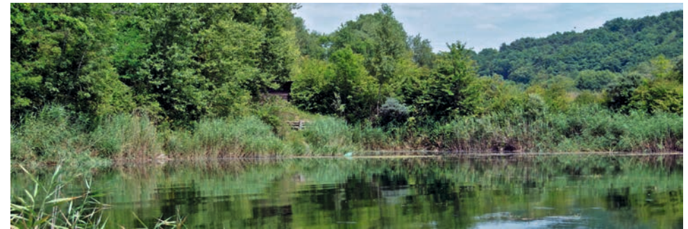
Lebensraum der Europäischen Sumpfschildkröte in der Schweiz im Schutzgebiet Moulin-de-Vert (Genf)

Auf den Roten Listen der gefährdeten Reptilien der Schweiz von 1982 beziehungsweise 1994 wird die Europäische Sumpfschildkröte als „ausgestorben“ taxiert, bis sich Ende der 1990er-Jahre Hinweise darauf verdichteten, dass möglicherweise noch autochthone Vorkommen an einigen Standorten in der Schweiz existieren. In der Roten Liste von 2005 wurde die Art folglich als „vom Aussterben bedroht“ („critically endangered“) eingestuft.