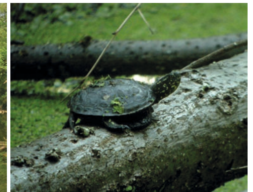
Ein Jungtier im Fadenbach (Nationalpark Donau-Auen) bäugt die Umgebung