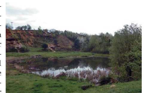
Wiederansiedlungsgebiet „Hölle von Rockenberg“ in der Wetterau, Hessen

Schon lange sind die historischen Vorkommen Europäischer Sumpfschildkröten in Deutschland mit wenigen Ausnahmen erloschen. Freilandstudien zeigten in den 1990er-Jahren für die Brandenburger Reliktpopulationen einen kritischen Zustand. Zur Rettung der überalterten und individuenarmen Populationen war ihre Stützung mit künstlich erbrüteten Gelegen unverzichtbar. Inzwischen stehen für Bestandsstützungen und Wiederansied-