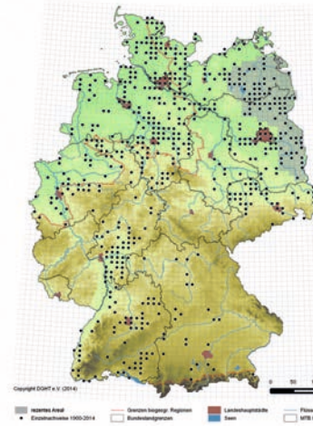
Verbreitung von Emys orbicularis in Deutschland. Einzelfunde von 1900–1914; grau hinterlegt ist das rezente Areal, rot sind die Landeshauptstädte