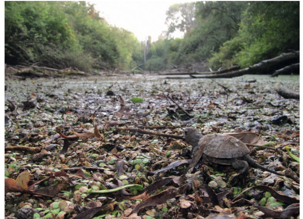
Ein Schlüpfling verlässt seine Gelegehöhle im Nationalpark Donau-Auen