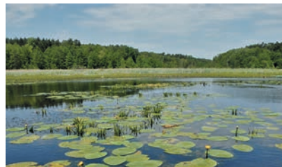
Lebensraum der Europäischen Sumpfschildkröte in Brandenburg