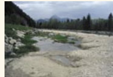
Lebensraum in Tirol