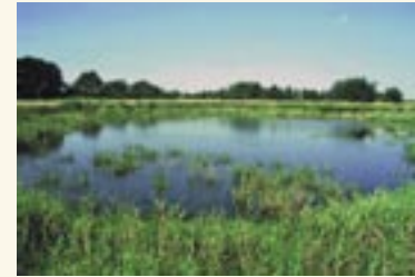
Laichgewässer in Norddeutschland

Die Gefährdungsursachen für den Laubfrosch reichen von der direkten Zerstörung der artemigen Land- und Wasserlebensräume über indirekte Beeinträchtigungen der Laichgewässer, z. B. durch fischereiliche Nutzung, bis hin zu den großflächigen Landschaftsveränderungen. Mit der weiträumigen Monotonisierung der Agrarlandschaft, oft eingeleitet durch Flurbereinigung und Grünlandumbau, Grünlandintensivierung sowie durch die Einebnung der Flächen ging auch der Verlust der Weidegewässer einher. In der Agrarlandschaft wurden selbst die Fluss- und Bachauen eingeeignet und nachhaltig verändert. Durch Begradigung und Verbau von Flüssen und Bächen und dem damit verbundenen Wegfall der natürlichen Dynamik in den Auellandschaften entstehen im Umfeld der Fließgewässer auch keine neuen Kleingewässer mehr. Hinzu kommt die Eutrophierung der noch vorhandenen Gewässer über Nährstoffeinträge aus den umliegenden landwirtschaftlichen Nutzflächen. Die dadurch bedingte schnell einsetzende Vegetationswandlung führt zum Verlust der Habitatqualität. In seinen Landlebensräumen kam es durch Hecken- und Strauchrodungen zum Verlust von Nahrungs-, Sommer- und Winterquartieren sowie Verbindungskorridoren.