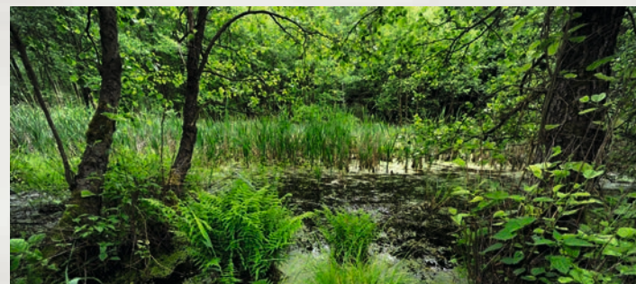
Waldweiher in Brandenburg

Als Laichplätze dienen dem Grasfrosch nahezu alle Gewässertypen, ob stehend oder fließend, besonnt oder beschattet. Das Spektrum reicht von temporären Kleinstgewässern wie wassergefüllte Wagenspuren und Tümpel über langsam fließende Bäche und Gräben bis hin zu dauerhaft wasserführenden Weihern, Gartenteichen und Seen. Auch die Landlebensräume des Grasfrosches sind sehr variabel. Meist werden krautig-grasige Habitate deutlich bevorzugt, zum Beispiel extensiv bewirtschaftete Wiesen, aber auch lichte Laub- und Mischwälder, Waldlichtungen, Bachufer oder naturnahe Gärten.