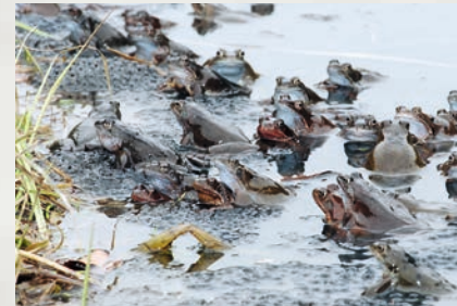
Laichgemeinschaft mit Laichteppichen

schon im zweiten Jahr, die größeren Weibchen oft erst im dritten. Einzelne Grasfrösche können im Freiland weit über zehn Jahre alt werden, die durchschnittliche Lebenserwartung beträgt kaum mehr als sieben oder acht Jahre.