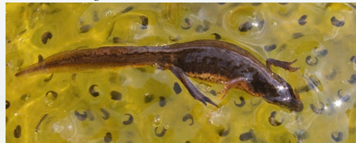
Molche sind bedeutende Grasfroschlaichräuber

Die vielfältige Nahrung des Grasfrosches wird vor allem vom Beuteangebot im Landlebensraum bestimmt. Insekten aller Art, Spinnentiere, Asseln, Tausendfüßer, Schnecken und Würmer gehören zur bevorzugten Beute. Feinde haben der Grasfrosch, seine Eier und Kaulquappen reichlich, zum Beispiel Fische, Molche, Marder, Füchse, Wildschweine, Eulen, Greifvögel, Reiher oder Störche.