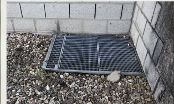
Abdecken und Einzäunen von Schächten bewahrt Tiere vor dem Absturz