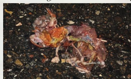
Für viele Wildtiere ist der Straßentod ein erheblicher Gefährdungsfaktor, so auch für den Grasfrosch