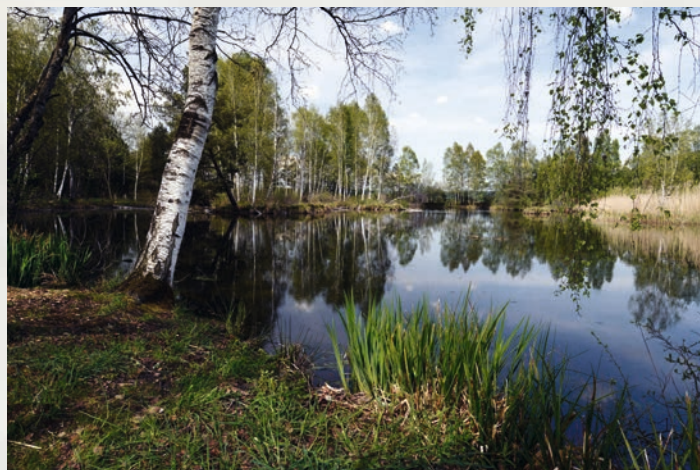
Grasfroschlaichgewässer in einem oberschwäbischen Moorgebiet